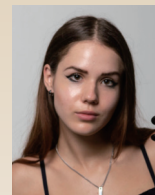
スコボトヴァ カテリーナ 【ウクライナ】