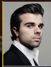
ヨシフ・イワノフ (ベルギー)