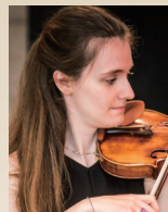
ルソハジャキ フィヴィ 【ギリシャ】