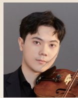
ワン ハオゴ 【中国】