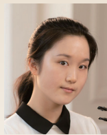
ワン ジンフェイ ダンダン 【中国】