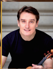
マーク・ゴトローニ (フィンランド)