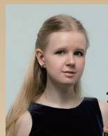
デヴツカヤ ソフィヤ 【ロシア】