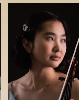
ナイトウ ノミ タケベ 【アメリカ/日本】