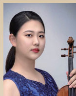
キム ジihin 【韓国】