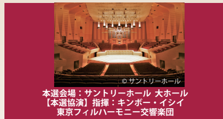
© サントリーホール 本選会場：サントリーホール 大ホール 【本選協演】指揮：キンポー・イシイ 東京フィルハーモニー交響楽団

予選 2024年10月16日(水)～19日(土) 14:00 浜離宮朝日ホール音楽ホール セミファイナル 2024年10月20日(日)～22日(火) 11:00 浜離宮朝日ホール音楽ホール 本選 2024年10月25日(金) 18:30・26日(土) 16:00 サントリーホール 大ホール ■入場料(税込)