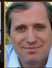
イツァーク・パシュコフスキー (ウクライナ/イスラエル)