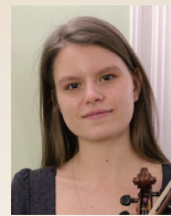
ジノヴァ タイシヤ 【ラトビア】