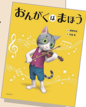
『おんがくはまほう』 文:篠崎 史紀 絵:村尾 巨 リトル・モア刊

マロさんの著作絵本『おんがくはまほう』を題材に、ワクワク・ドキドキするクラシック音楽のたのしさや子どものための音楽教育についてお話します。美しいヴァイオリンの調べとともに、お楽しみください。