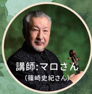
講師:マロさん (篠崎史紀さん)

篠崎史紀 (しのざき ふみのり) NHK 交響楽団特別コンサートマスター。愛称“マロ”。3歳より両親の手ほどきを受け、1981年ウィーン市立音楽院に入学。翌年コンツェルト・ハウスでコンサート・デビューを飾る。その後ヨーロッパの主要なコンクールで数々の受賞を果たしヨーロッパを中心にソロ、室内楽と幅広く活動。 1988年帰国後、群響、読響のコンサートマスターを経て、97年N響のコンサートマスターに就任。以来“N響の顔”として国内外で活躍。「2020年度第33回ミュージック・ベンクラブ音楽賞」受賞。